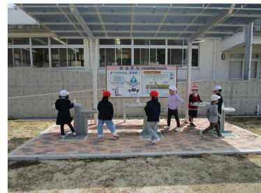
< 「のめるん」にて >