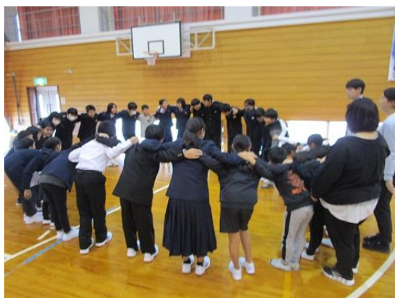
<円陣を組むうずしおグループ>