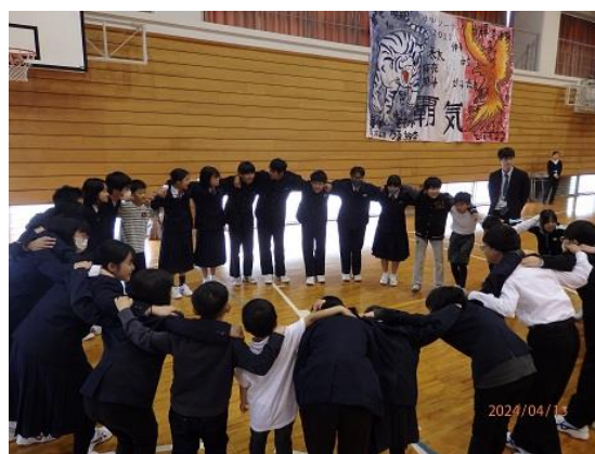
<円陣を組むたちばなグループ>