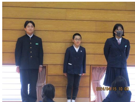
＜リーダーの自己紹介（たちばな）＞