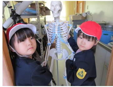
< 理科準備室にて >