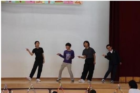
< 6年生の出し物：1年生のお約束 >