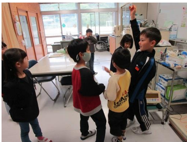
< さあ！出発だ >

1・2年生が4月16日（火）、24日（水）に、生活科として学校探検を行いました。2年生がうまくリードしながら、学校中の教室を案内しました。また、運動場の遊具なども体験しました。これからもどんどん学校の中を探検して、中島小学校でのびのび成長してくれることを願います。