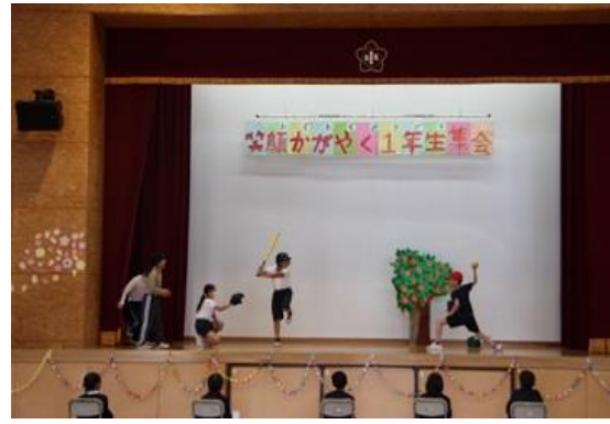
< 5年生の出し物：わくわく劇場の紹介 >