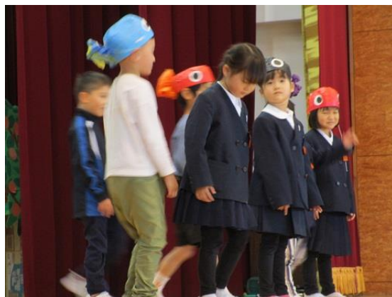
<2年生の出し物：魚つかみどりの紹介>