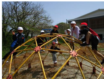
< 遊具で遊ぼう >