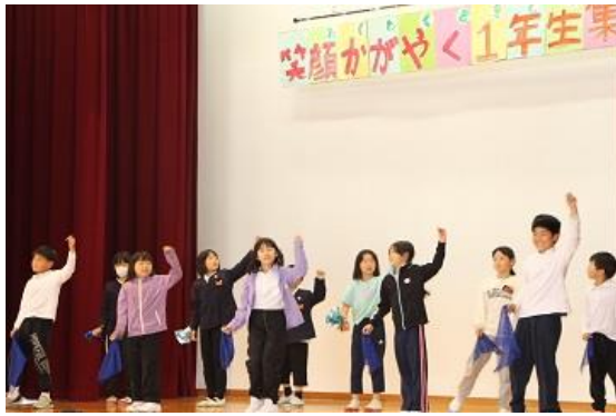
< 3・4年生の出し物：運動会の紹介 >