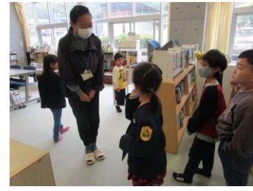
< 図書スペースにて >