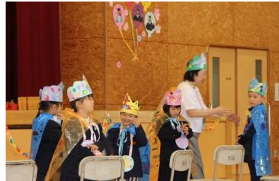
< もらったプレゼントで大変身 >