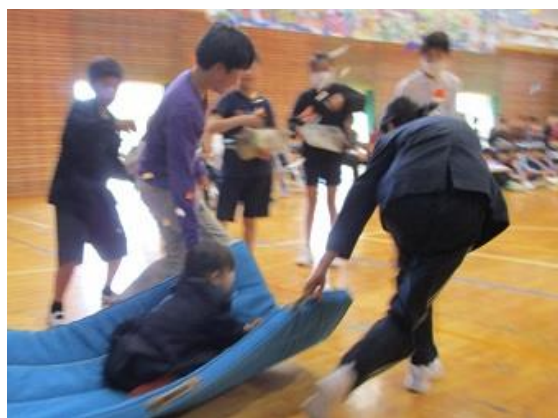
<1年生の入場の様子：魔法のじゅうたん>

4月17日(水)の5校時に、「わくわくどきどき 笑顔かがやく1年生集会」と題して、全校で1年生を迎える会を開きました。参観日として保護者の皆様にも参観していただき、たくさんの方々に5名の1年生を迎えました。集会はマットに乗って1年生が入場するところから始まりました。そして、学年ごとに中島小学校の行事を紹介があり、手作りのプレゼントを受け取った1年生はとてもいい笑顔でした。この集会を終えて1年生も中島小学校の一員となったことを実感できたのではないかと思います。