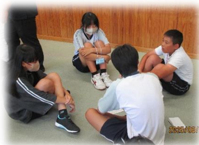
＜中島のいいところ発表＞