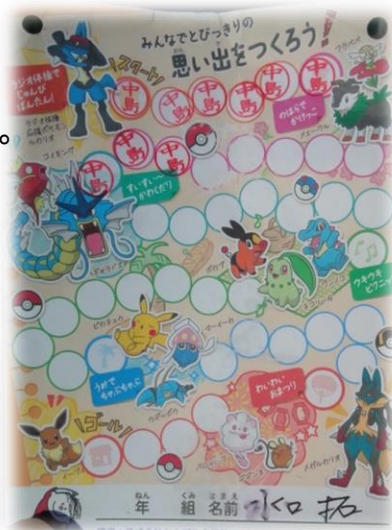
＜ラジオ体操カード＞