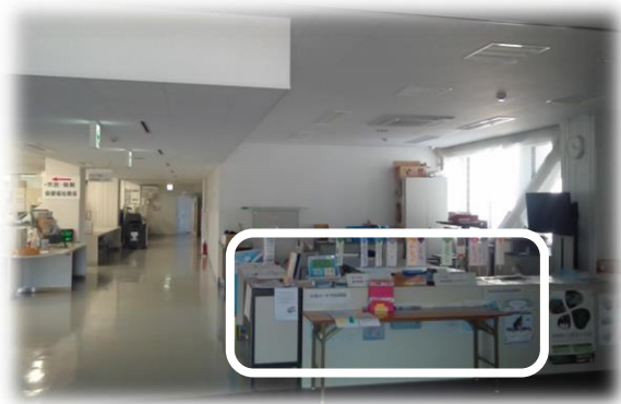
＜中島支所入口の右側の様子＞

子どもたちは、千羽鶴作成に当たって、その経緯や願いを「地域の方にも知ってほしい」という熱い思いもっており、折り鶴の作成を皆さんにお願いすることとしました。中島支所や文化センター、大浦港フェリー乗り場等にお願いのポスターを掲示して「折り鶴ポスト」を設置しておりますので、千羽鶴作成へのご協力をよろしくお願いします。