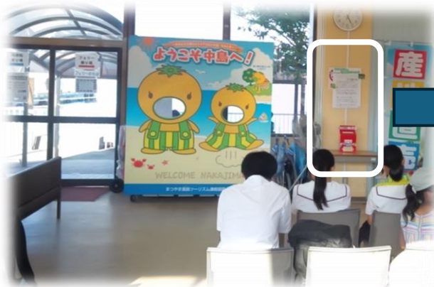
＜大浦港のフェリー乗り場の様子＞