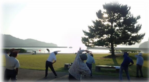
＜海に向かってラジオ体操＞

ラジオ体操は、毎日続けることで体力向上にもつながります。皆さんも朝の運動はいかがですか？