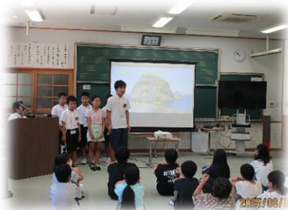
＜中島クイズを出題＞

8月5日（火）に中島中学校の青潮寮入寮体験に6年生の希望者が参加をしました。本校6年生は寮に入るわけではありませんが、体験に参加する友達は、6年生が中島中学校に入学した時に、同級生として学校生活を送ることになるかもしれません。「中島よろこ」の気持ちを込めて中島クイズを出題したり、グループ討議に参加したりして入寮体験を盛り上げました。普段は体験できない青潮寮内の部屋の様子を見学することができ、大満足な様子でした。参加者した16名の友達も充実した時間を過ごせたはずですよ。入寮できる友達は約5名とのことですが、4月に会えることがとても楽しみです。